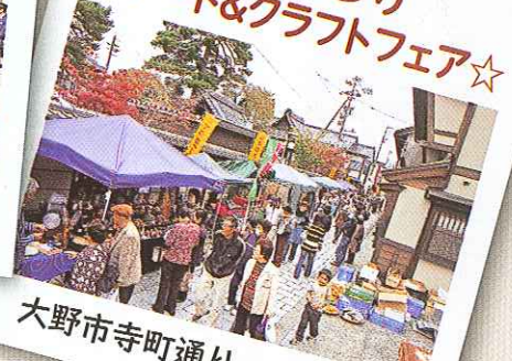
大野市寺町通り・七間通り